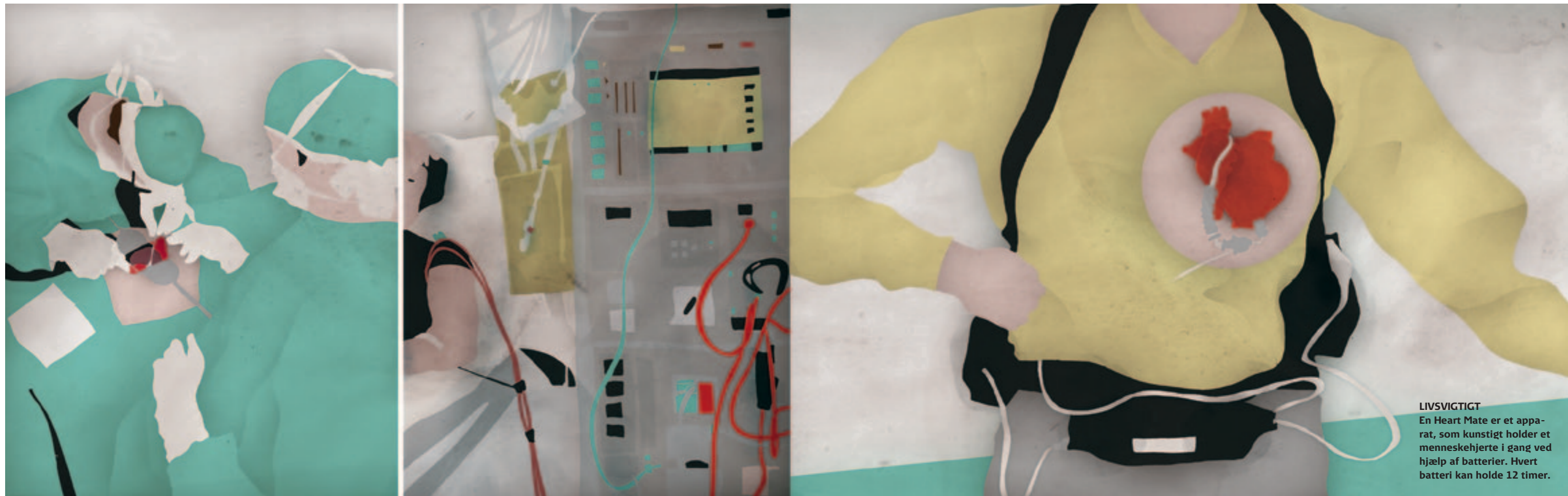
LIVSVIGTIGT En Heart Mate er et apparat, som kunstigt holder et menneskehjerte i gang ved hjælp af batterier. Hvert batteri kan holde 12 timer.

Men hvad nu, hvis jeg ikke kan få børn? Hvor gammel bliver jeg egentlig?