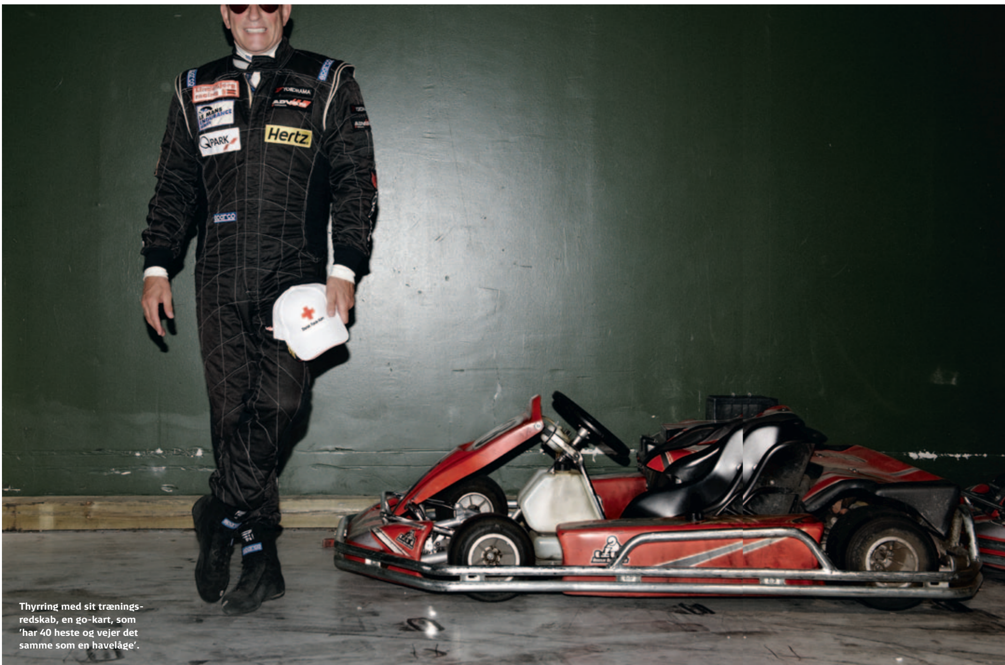
Thyrring med sit træningsredskab, en go-kart, som 'har 40 heste og vejer det samme som en havelåge'.